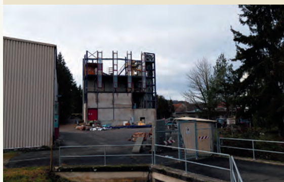
Stauseestrasse © 2023 Monika Meier