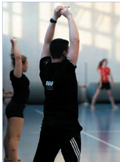
© 2022 Turnverein Eien - Kleindöttingen

Ferienpasszeit - Die Kurse finden von Samstag, 8. April bis Sonntag, 23. April 2023, statt. Alle Schülerinnen und Schüler der 1.-9. Klasse, die in der Ferienpass-Region wohnen, können beim Ferienpass mitmachen und neu bis zu fünf Kurse besuchen. Dank grosszügigen und zum Teil langjährigen Sponsoren, können wir den Ferienpass 2023 erneut für 18 Franken anbieten. Wir dürfen also unserem Motto «viel Spass für wenig Geld» treu bleiben.