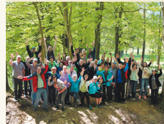
Frauen- und Männerchor Kleindöttingen

Anmeldung erforderlich bis am 21. September 2018 an gemeinde@boettstein.ch oder 056 269 12 20.